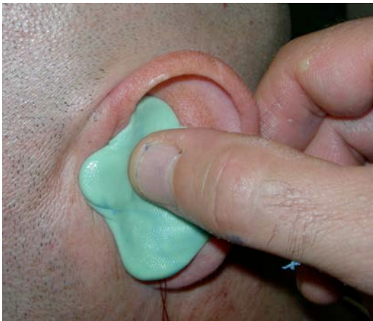
PRESSIONE CON IL POLLICE

NOTARE LA MANCANZA DEI PARTICOLARI DELLA CONCA SUPERIORE E DEL CANALE