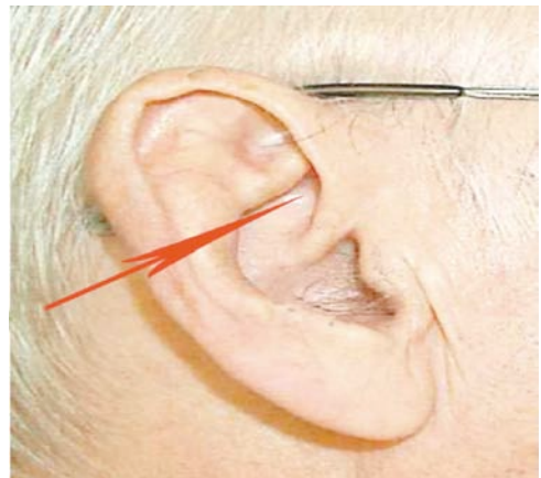
CONCA SUPERIORE - IMPORTANTE